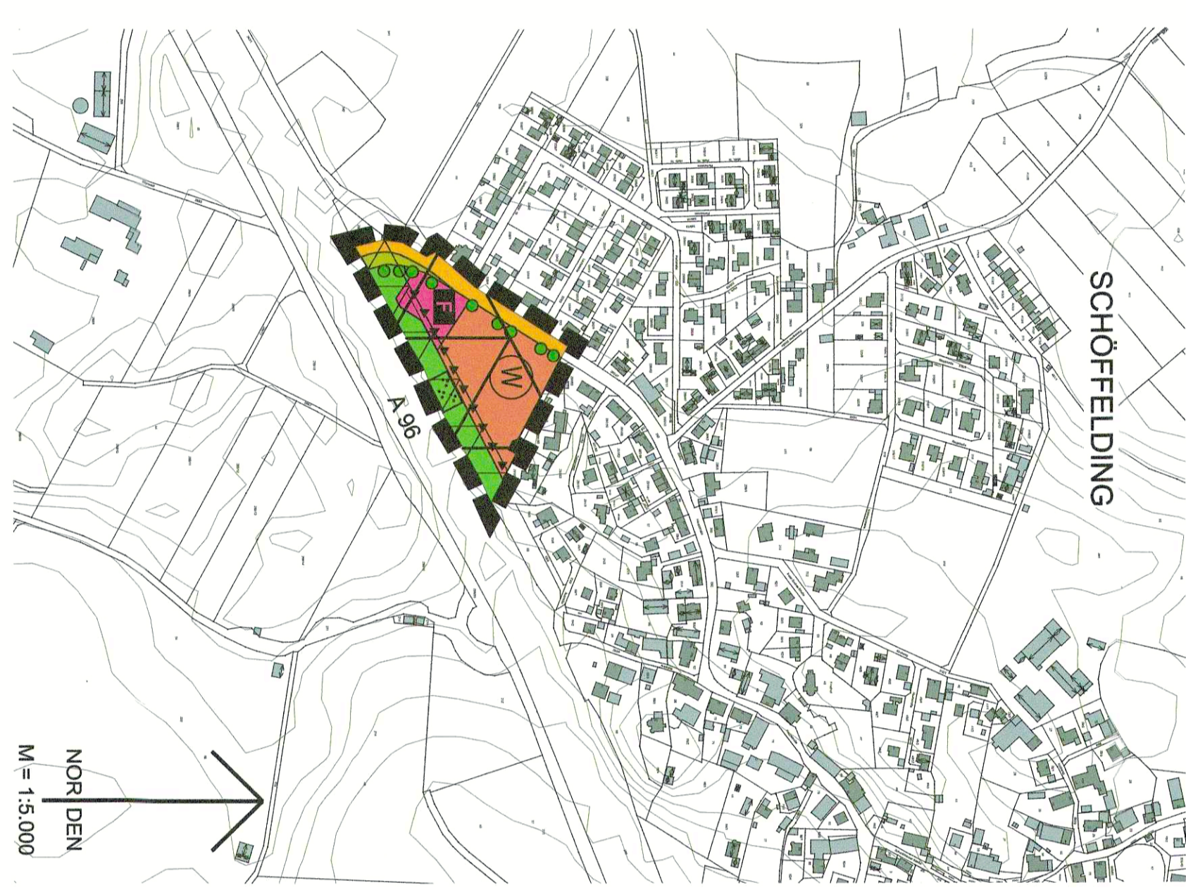
Geobasisdaten © Bayerische Vermessungsverwaltung 04/2022 Darstellung der Flurkarte als Eigentumsnachweis nicht geeignet

34. FNP-Änderung Schöffelding-Süd Neue Darstellungen