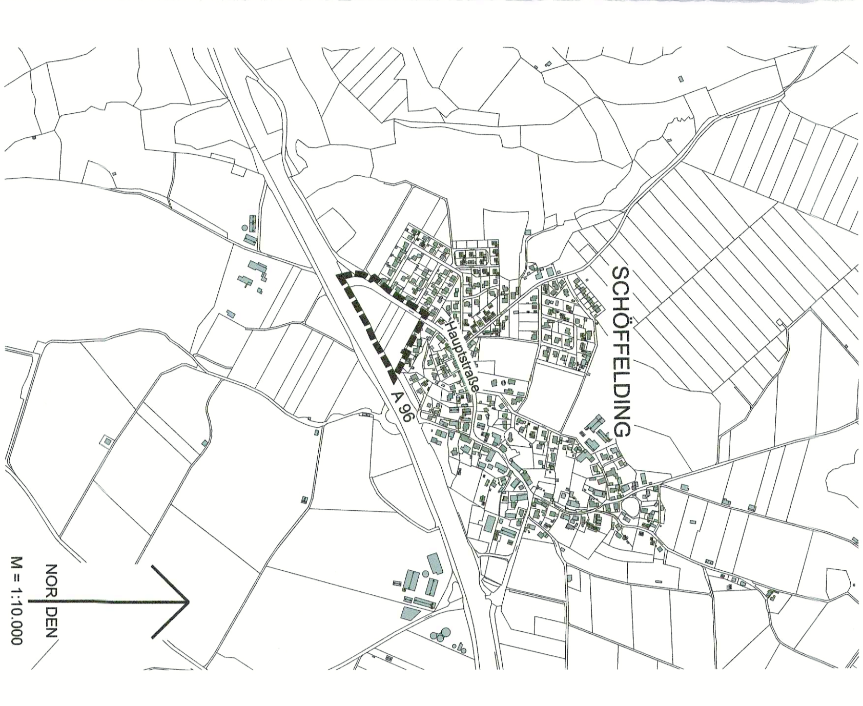
Geobasisdaten © Bayerische Vermessungsverwaltung 04/2022 Darstellung der Flurkarte als Eigentumsnachweis nicht geeignet

Rechtswirksamer Flächennutzungsplan i. d. F. v. 31.07.2007 (Ausschnitt) mit Geltungsbereich der Änderung - bisherige Darstellungen